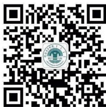
呼伦贝尔学院官方微信