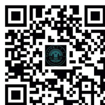
呼伦贝尔学院2026年 普通本科招生章程