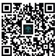
呼伦贝尔学院招生信息网