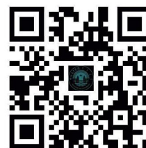
呼伦贝尔学院本科学生 转专业管理办法